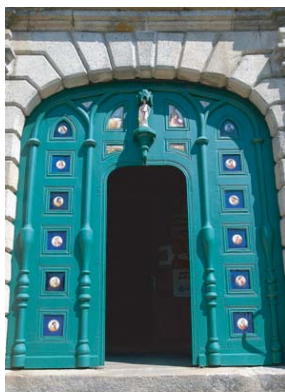
Portail de l'église

10 Remonter la rue goudronnée et tourner à gauche et ensuite à gauche. Au terre-plein, monter à droite jusqu'à l'Office de Tourisme.