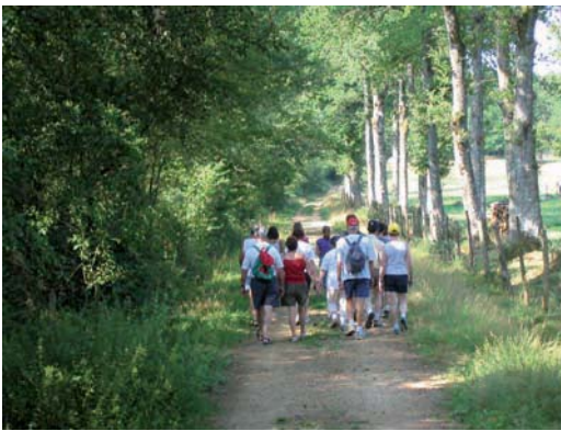
Paysage de la commune de Nexon

7 Prendre le chemin à droite qui redescend et rejoint les rives de l'étang de la Lande que vous longez. Arrivée à la base de loisirs : baignade l'été, pêche toute l'année, camping deux étoiles, location de chalets... rejoindre le parking.