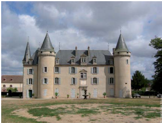
Château de Nexon

8 Variante : au point 8 possibilité d'allonger votre parcours. Prendre le chemin à gauche qui devient goudronné, arrivé à la route (La croix Sainte-Valérie), l'emprunter à droite. Rejoindre le chemin en bordure de l'étang à droite puis à gauche pour rejoindre le point de départ.